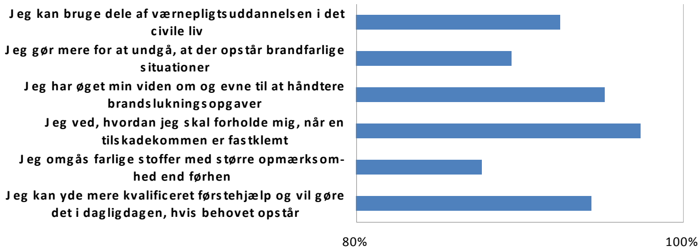
Figuren viser andel af respondenter, der har svaret bekræftende på det stillede spørgsmål