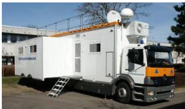
Beredskabsstyrelsens ledelses- og kommunikationsmodul (LKM) kan anvendes af indsatsledelsen på et ulykkessted.

Retningslinjerne kan downloades fra Beredskabsstyrelsens hjemmeside, www.brs.dk .