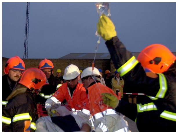
Samarbejde mellem redningsberedskabet og sundhedsberedskabet.

Politiet har ansvaret for den koordinerende ledelse, og dermed at den samlede indsats foregår så effektivt som muligt. Indsatslederen fra det kommunale redningsberedskab har ansvaret for den tekniske ledelse af indsatsen på skadestedet, herunder ansvaret for alle indsatte enheders færden på skadestedet. Lederne af andre indsatte beredskaber har ansvaret for indsatsen inden for hver deres sektor, jf. det generelle sektoransvarsprincip.