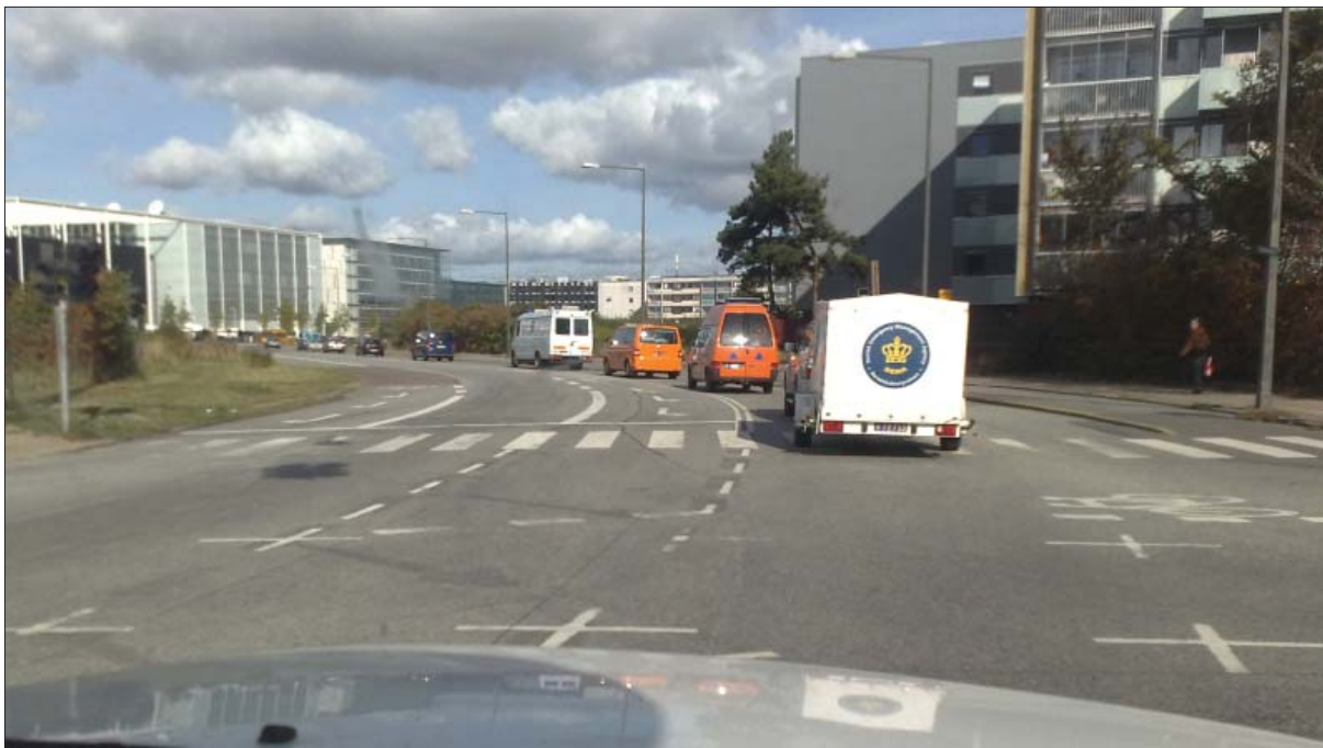
Kortegekørsel, IOC-topmødet. Beredskabsstyrelsens kemiske beredskab og nukleare beredskab deltog med måleudstyr og -vogne under IOC-topmødet og COP15

bet udgør desuden en vigtig del af rekrutteringsgrundlaget til det niveaudelte beredskab. Endelig afspejles effekten for redningsberedskabet tillige af kvalitetsmålingerne med centrenes indsatser. Det er de værnepligtige, der udgør hovedparten af det indsatte mandskab, som 98 pct. af rekvirenterne er tilfredse eller meget tilfredse med.