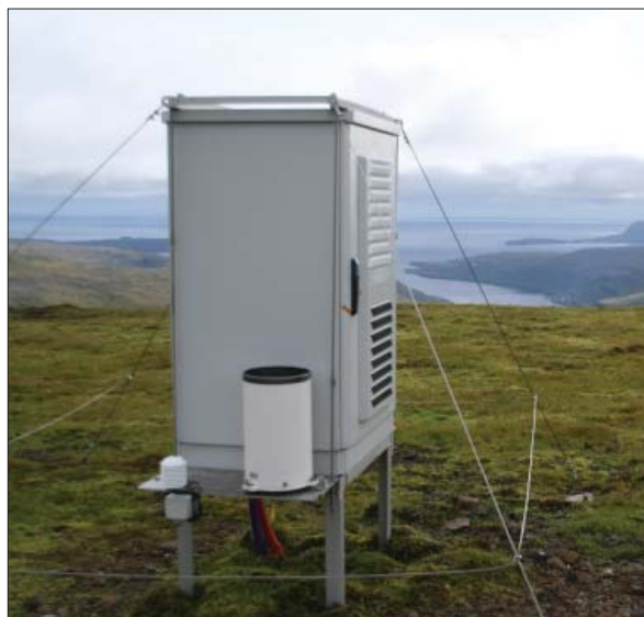
Nuklear målestation på Færøerne. Udviklet af Beredskabsstyrelsen og overdraget til de færøske myndigheder i 2009

Der ses en faldende tendens vedrørende omkostningerne til støtteopgaver, hvor bl.a. effekten af den i 2008 gennemførte strukturændring i styrelsen nu ses at være slået igennem.