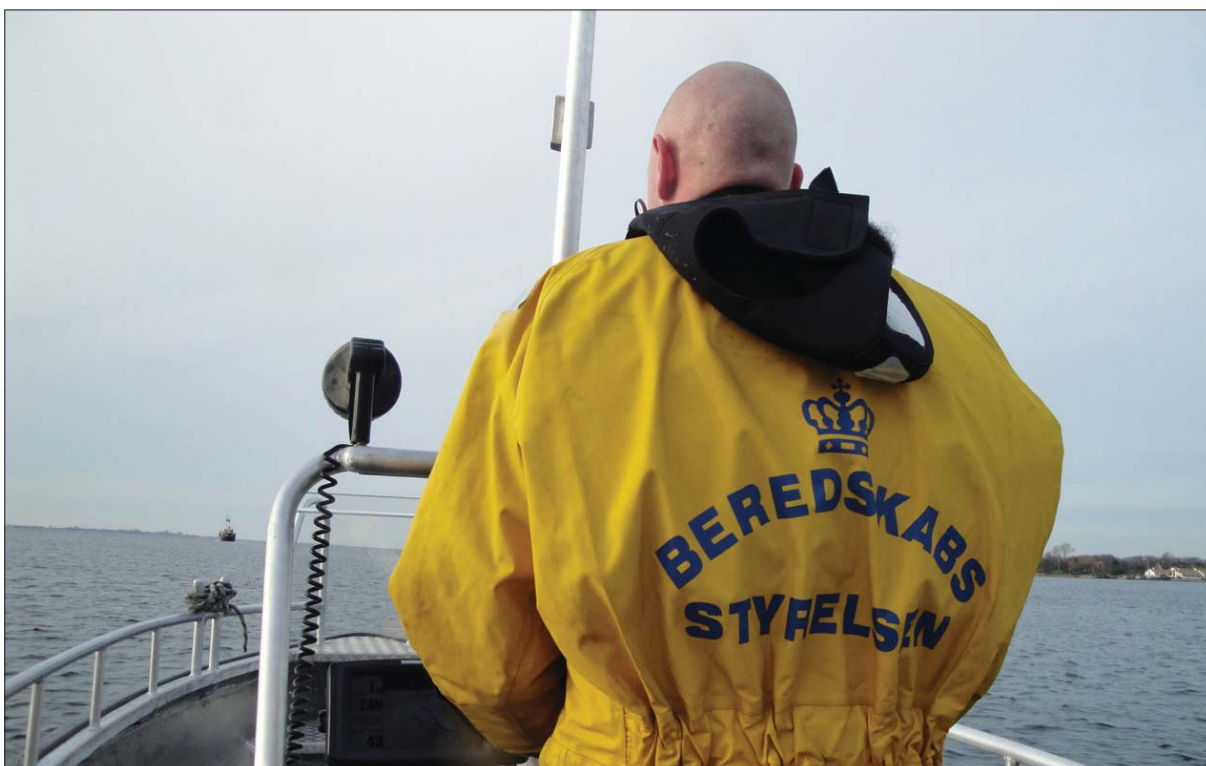
Fartøj til bl.a. udlægning af flydespærringer i forbindelse med olieforurening

Beredskabsstyrelsen har bl.a. koordineret KRISØV 2009, som er en omfattende krisestyringsøvelse for de centrale beredskabsmyndigheder, herunder bl.a. redningsberedskab, politi, forsvar og regeringens