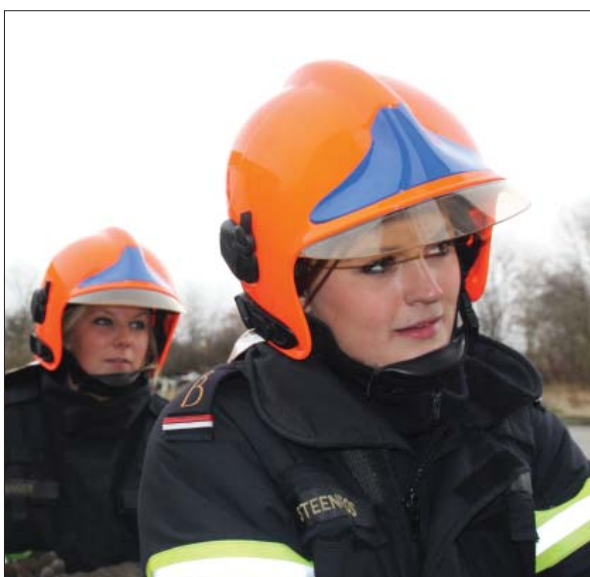
Værnepligtige under uddannelse, 2009

Beredskabsstyrelsens og redningsberedskabets opgaver er fastlagt i beredskabsloven, beskyttelsesrumloven samt loven om sikkerhedsmæssige og miljømæssige forhold ved atomanlæg.