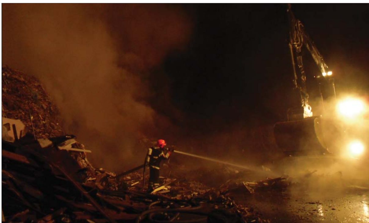
Brand, Toelt losseplads, 2009

og budgetteres derfor generelt konservativt. I 2009 har bl.a. beredskabet i forbindelse med IOC-topmødet i København og det efterfølgende COP 15 topmøde genereret en række omkostninger, der er blevet refunderet (faktureret) og dermed medført indtægter. Det drejer sig eksempelvis om udgifter på baggrund af politiets anmodninger om støtte i forbindelse med varetagelsen af sikkerhedsopgaverne ved COP 15. Ligeledes har styrelsen som nævnt under afsnit 1.3. trods finanskrisen været i stand til at opnå et tilfredsstillende indtægtsniveau på den indtægtsdækkede virksomhed.