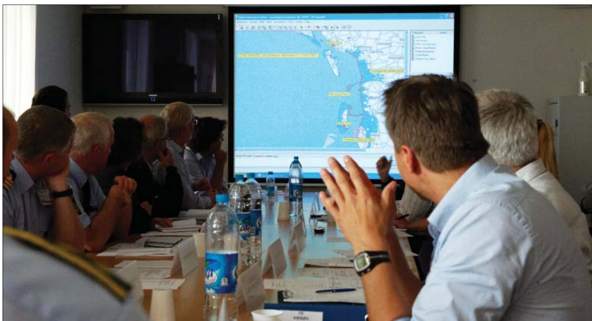
National krisestyringsøvelse 2009, den nationale operative stab - NOST

Beredskabsstyrelsen har i 2009 i vidt omfang levet op til sin mission om gennem udvikling og operativ støtte til samfundets samlede beredskab at arbejde for et robust samfund. Vurderingerne af Beredskabsstyrelsens aktiviteter på det operative område og uddannelsesområdet er positive, der er i 2009 ydermere i stort omfang trukket på Beredskabsstyrelsens kapaciteter, og der er