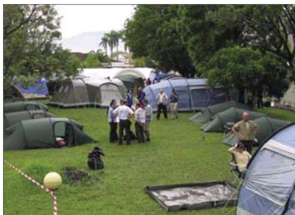
I forbindelse med jordskælv i Indonesien 2009 udsendte Beredskabsstyrelsen en Base camp Light som fælles lejr med kommunikations- og kontorudstyr for FN's og EU's katastrofeekspertes.

Ved udgangen af 2009 havde Beredskabsstyrelsen en samlet langfristet gæld bestående af gælden på FF4 på 418,5 mio. kr. og en samlet bygge og it-kredit på 22,6 mio. kr. Til sammenligning havde Beredskabsstyrelsen ved udgangen af 2009 materielle og immaterielle anlægsaktiver for 438,7 mio. kr. og igangværende arbejder og udviklingsprojekter under opførelse for 31,2 mio. kr. Forskellen på 20,2 mio. kr. og 8,6 mio. kr. skyldes bogførte indkøb i supplementsperioden. Differencen på den uforrentede FF5 skyldes dels ovennævnte køb i supplementsperioden, dels indregninger af hensættelser ved årsafslutningen.