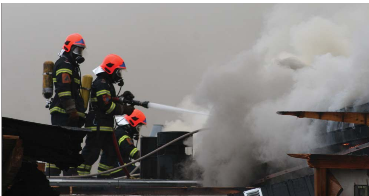
Brand, Albertslundcentret, 2009

* Der kan forekomme afrundingsforskelle i tabellens tal.