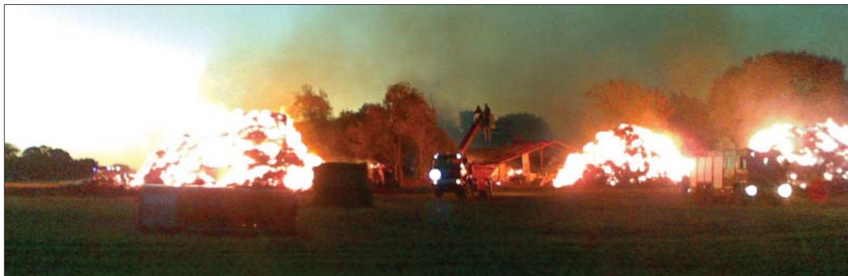
Brand i Favrskov Kommune. Beredskabsstyrelsen assisterede med 27 mand

gennemført en række projekter til udvikling af redningsberedskabet. Det er derfor samlet set vurderingen, at årets faglige resultat er tilfredsstillende.