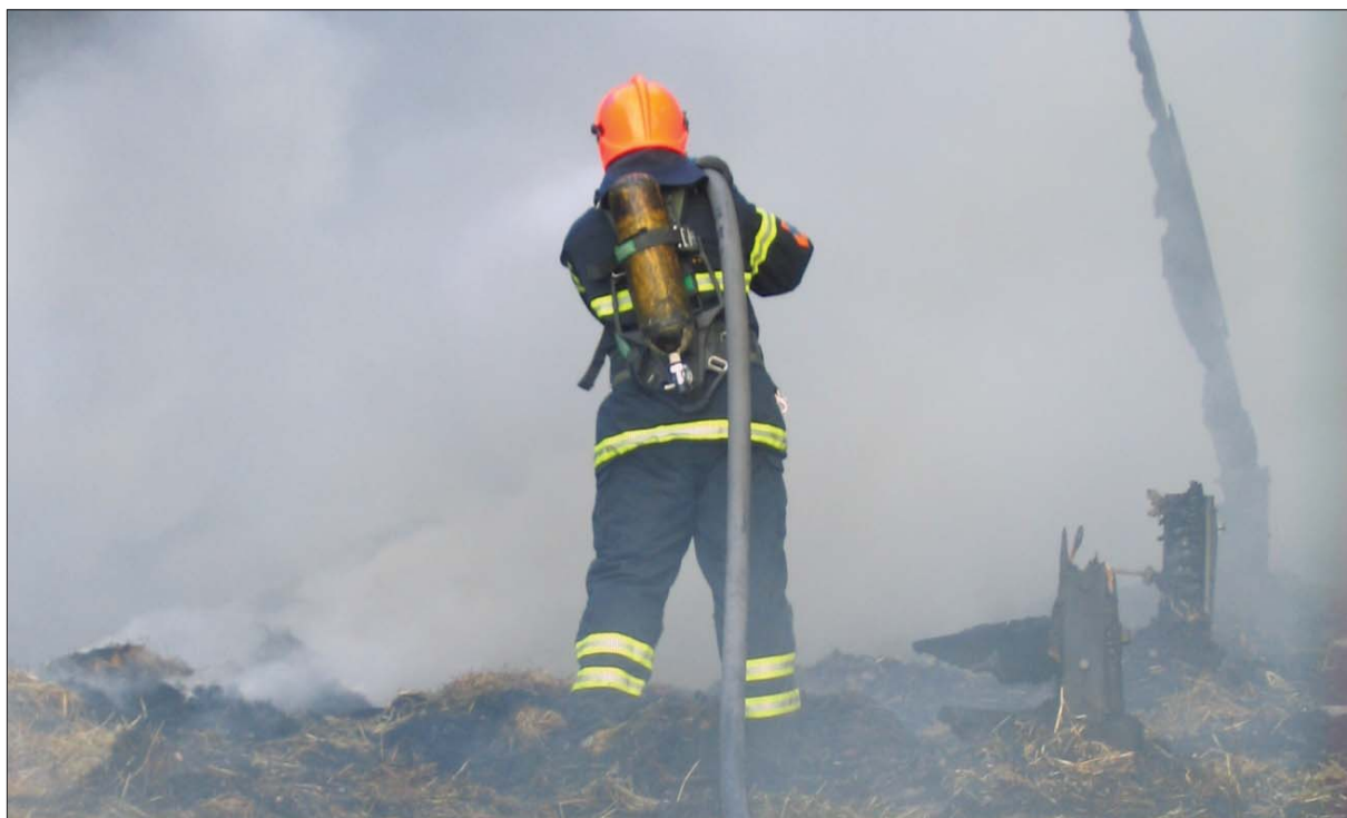
Brand, Ishøj Dyrepark, 2009

Brandsikkerheden i almene boliger er blevet undersøgt og analyseret for at blotlægge behovet for en styrket indsats. Det vurderes nu, hvordan resultatet kan fremme brandsikkerheden i almene boliger.