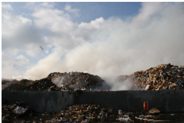
Foto fra lossepladsen i Toelt, oktober 2009

Evalueringen startede i december 2009 og forventes at blive offentliggjort i løbet af efteråret 2010.