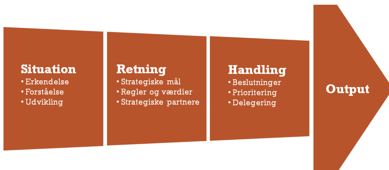
Figur 1: Beslutningsstøttemodellen 'Situation, Retning, Handling'

Der eksisterer mange forskellige beslutningsstøttemodeller, som topledere kan gøre brug af. Hvis en model skal være anvendelig under kriser, bør den imidlertid være enkel som modvægt til den kompleksitet, som kriser naturligt indebærer. At anvende en kompliceret model med mange elementer kan betyde, at tempoet i krisestaben sænkes, og at krisestaben dermed ikke kan følge med krisens udvikling. Beredskabsstyrelsen har derfor udviklet modellen 'Situation, Retning, Handling'. Modellen er enkel, overskuelig, kronologisk opbygget og lettilgængelig.