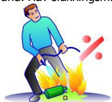
En vandstråle kan sprede branden