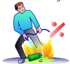
En vandstråle kan sprede branden